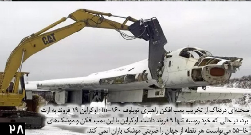
صحنه ای دردناک از تخریب بمب افکن راهبری توپلوف Tu-۱۶۰؛ اوکراین ۱۹ فرورد به ارت برد، در حالی که خود روسیه تنها ۹ فرورد داشت. اوکراین با این بمب افکن و موشک های خا-۵۵ می توانست هر نقطه از جهان را ضربتی موشک باران اتمی کند.

نظامی بین روسیه و جهان غرب امکان تبدیل به جنگ جهانی سوم و جنگی با سلاح های اتمی خواهد شد. قطعا اوکراین چنین ارزشی برای جهان غرب ندارد.