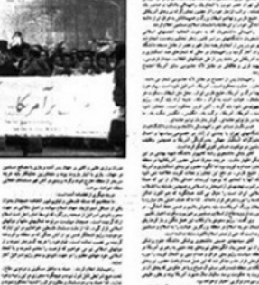
دانشجویان و دانشگاهیان تهران تاجم نظامی آمریکا و منجدانش به عراق را محکوم کردند