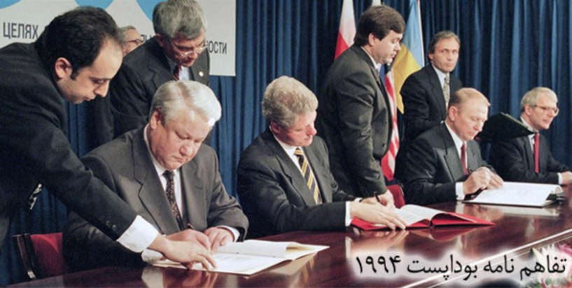
تفاهم نامه بوداپست ۱۹۹۴