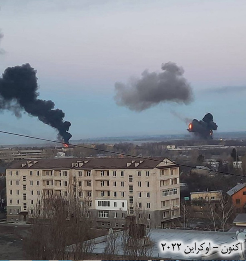
اکنون - اوکراین ۲۰۲۲