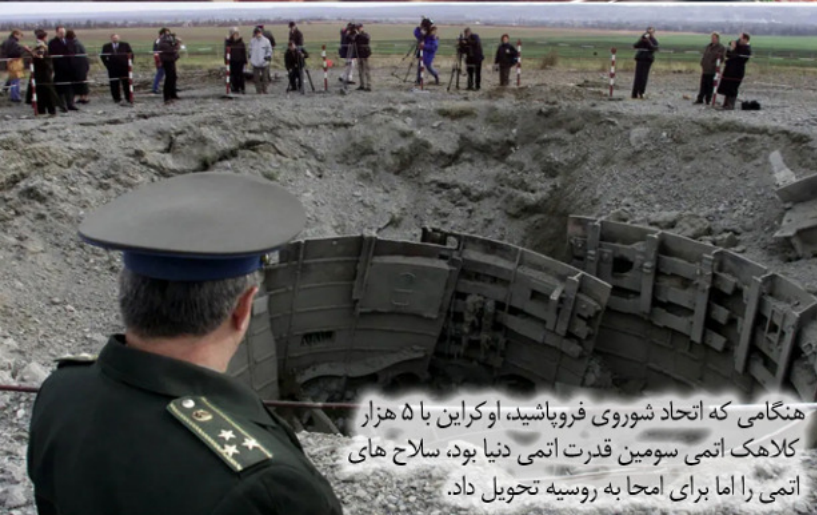
هنگامی که اتحاد شوروی فروپاشید، اوکراین با ۵ هزار کلاهک اتمی سومین قدرت اتمی دنیا بود، سلاح های اتمی را اما برای امحا به روسیه تحویل داد.